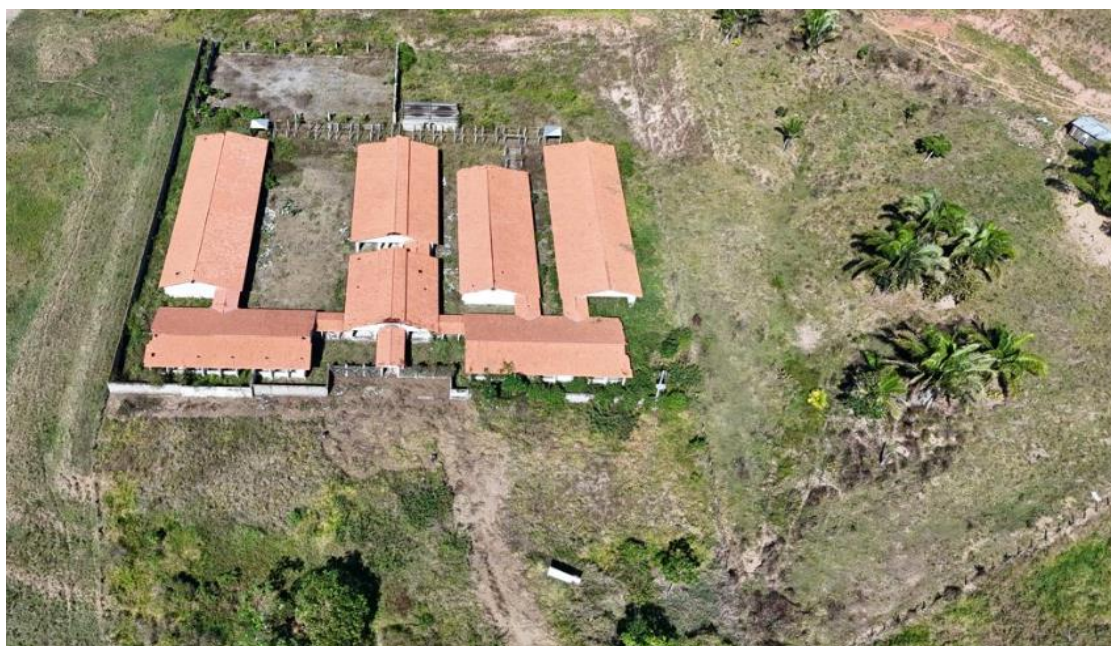
IMAGEM 02: Localizada na BR 364, KM 17, Sentido Tarauacá/Feijó, Comunidade Esperança, no Município de Tarauacá/AC.

1.3 - Localização da Obra: A obra será executada na, localizada na BR 364, KM 17, Sentido Tarauacá/Feijó, Comunidade Esperança, no Município de Tarauacá/Acre.