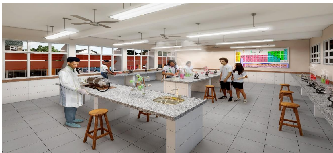
Imagens ilustrativas: Parte frontal da escola e demais dependências

8.16 - No Espaço Educativo Urbano e Rural de 12 Salas de Aula, o dimensionamento dos ambientes atende, sempre que possível, as recomendações técnicas do FNDE. A técnica construtiva adotada é simples, possibilitando a construção do edifício escolar em qualquer região do Brasil, adotando materiais facilmente encontrados no comércio e não necessitando de mão-de-obra especializada.